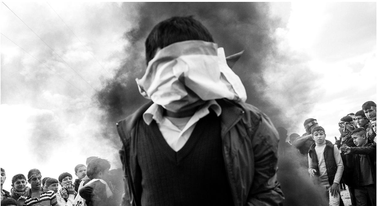
در ایام نوروز، مردم حلقه‌های بزرگی از آتش درست می‌کنند و از روی آن‌ها می‌پرند. در این تصویر، کودکی که پرچم ی‌پگ (یگان‌های مدافع خلق‌گرد) را دور صورت‌اش بسته، در حال پریدن از روی آتش است. ۱۷ مارس ۲۰۱۶، سوروچ، شانلی‌اورفه، ترکیه.