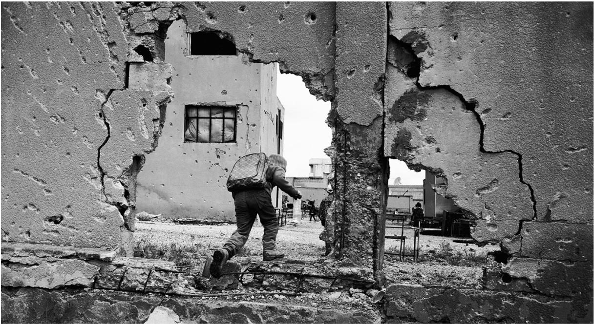
غیر نظامیان در حال بازگشت به کوبانی. ۲۳ آوریل ۲۰۱۵، کوبانی، سوریه.