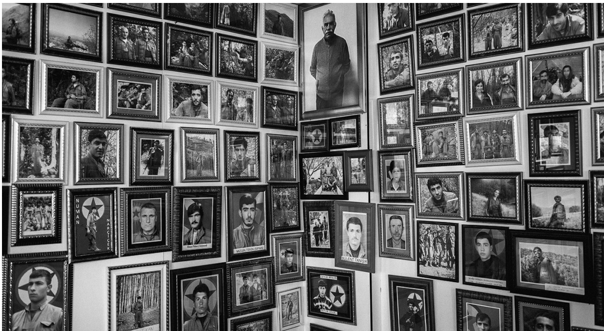
گرامی داشتِ جان باختگان جنگ بین ارتش ترکیه و پکک (حزب کارگران کوردستان). ۲۰ مارس ۲۰۱۵، لیجه، دیاربکر، ترکیه.