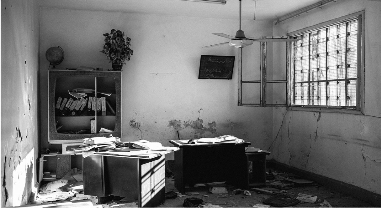
دفتر متروکه‌ی دولتی در کوبانی. ۱۸ آوریل ۲۰۱۵، کوبانی، سوریه.