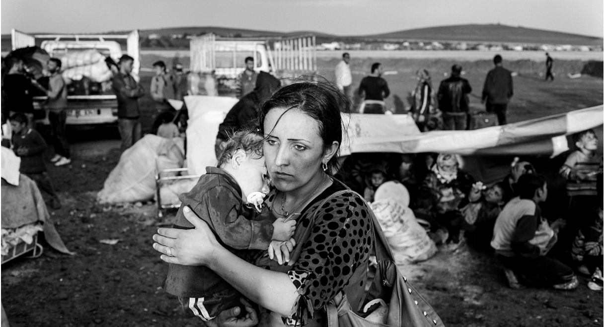
زنی که پسر خردسال اش را در آغوش گرفته از مرز شمالی سوریه عبور کرده و قدم به خاک ترکیه گذاشته است. دوم اکتبر ۲۰۱۴، سوروج، شانلی اورفه، ترکیه.