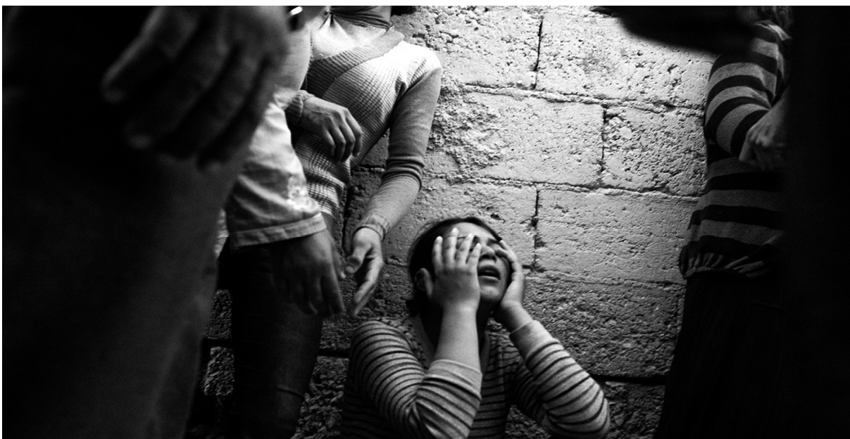
زنی در حال سوگواری برای شوهرش که در اثر برق گرفتگی به خاطر نقص در سیم‌کشی ساختمان محل زندگی‌شان جان باخته است. ۷ اکتبر ۲۰۱۴، سوروج، شانلی‌اورفه، ترکیه.