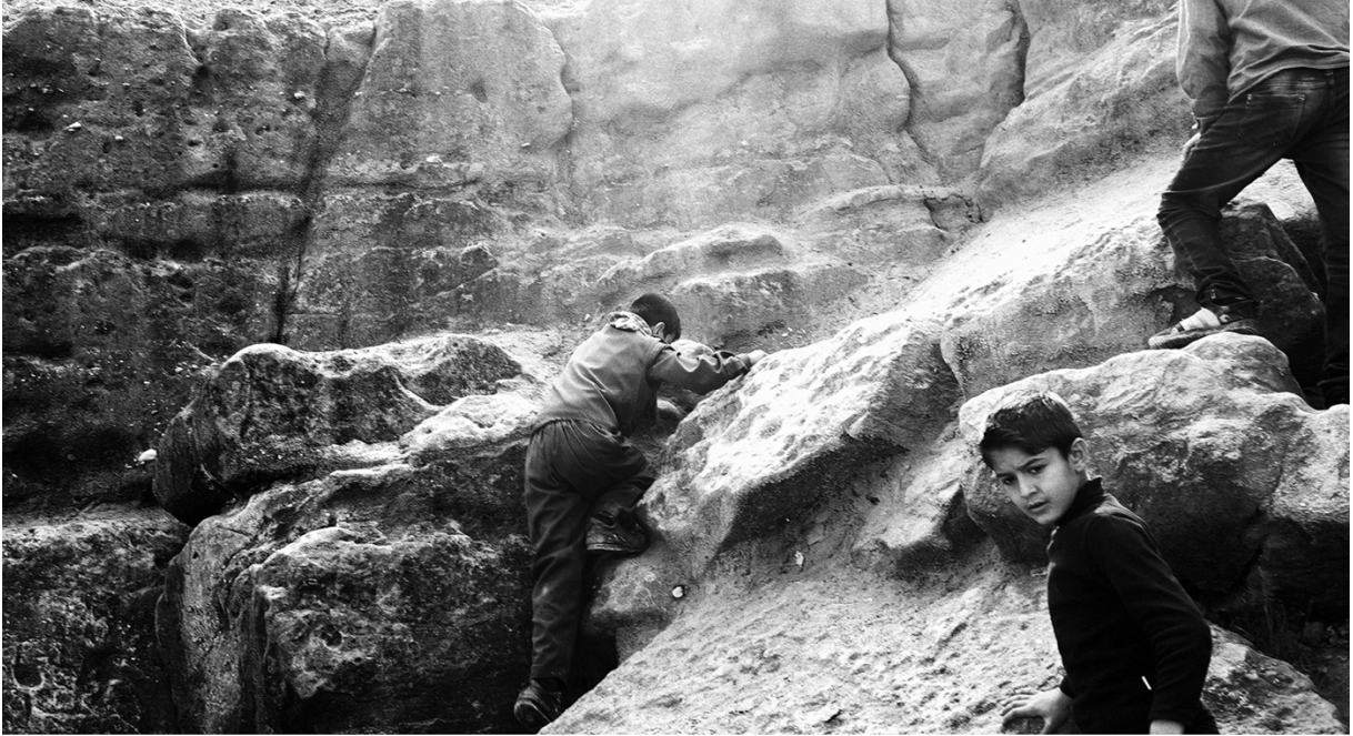
کودکان در حال بالا رفتن از کوه جودی در ایام نوروز در چیزه. ۱۸ مارس ۲۰۱۵، چیزه، شیرناک، ترکیه.