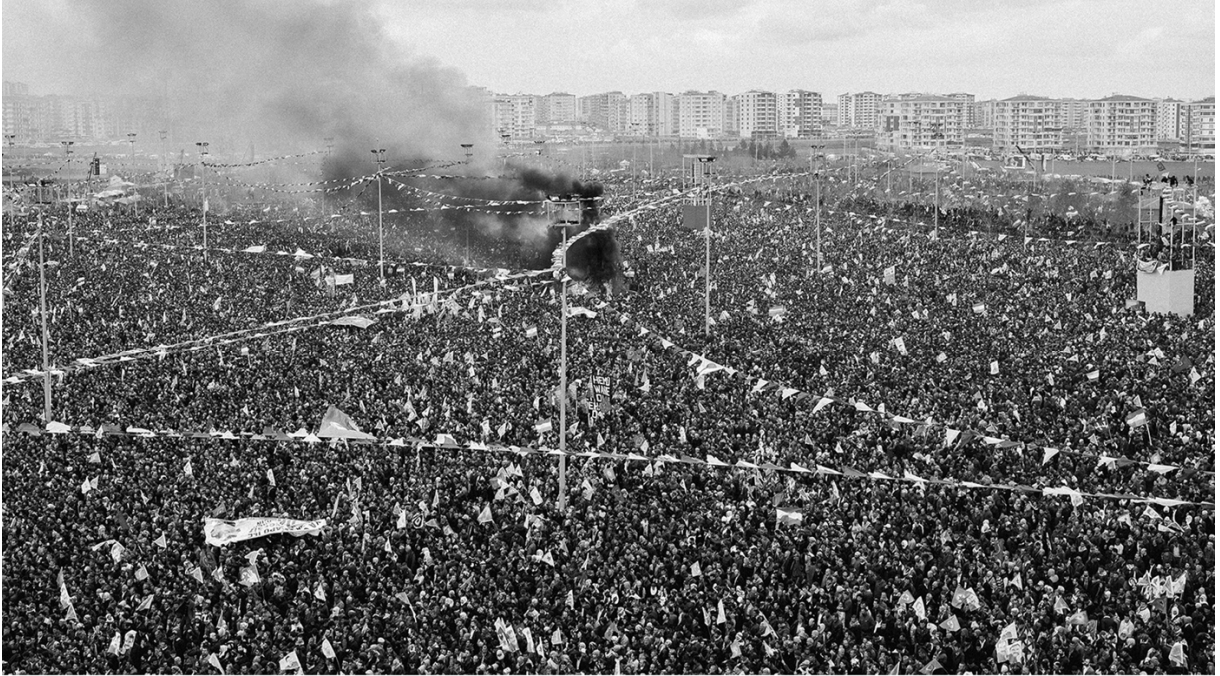
جشن نوروز که به شادی برای پیروزی درکوبانی اختصاص یافته است. میلیون‌ها نفر برای این جشن در میدانی در دیاربکر جمع شده‌اند. ۲۱ مارس ۲۰۱۵، دیاربکر، ترکیه.